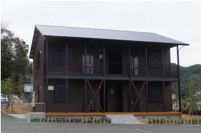
（施設管理者：農業法人株式会社秋津野）